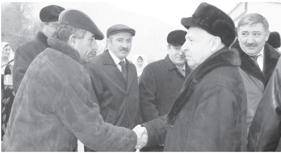
ВукIарав редактор Г.Г.Пумаханов М.Г.Палиевгун