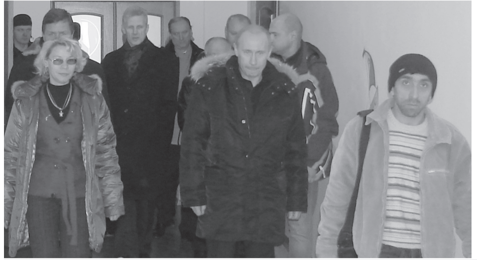
Россиялзул бетIер В. Путингун районалзул нухмалзулезул дандIиваялда